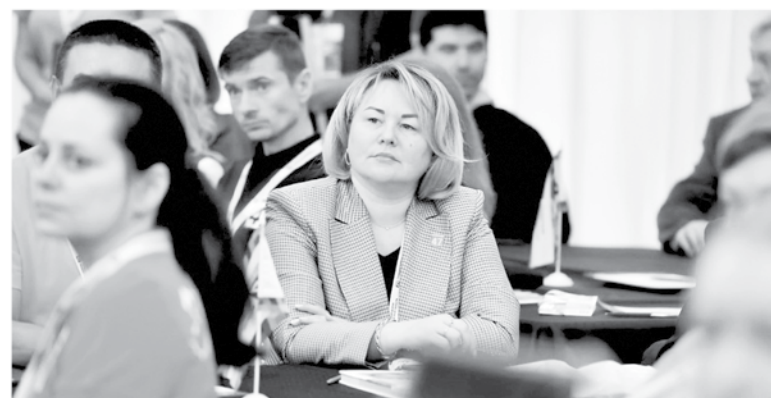
■ Лира Бурак — председатель комитета по местному самоуправлению, межнациональным и межконфессиональным отношениям Ленобласти

— Уже 10 лет в Ленобласти развивается инициативное бюджетирование — подход, при котором граждане сами определяют направление расходования средств. Какова динамика этого процесса?